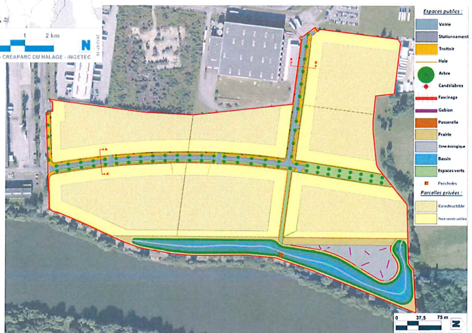
Plan d'aménagement de la ZAC du Halage